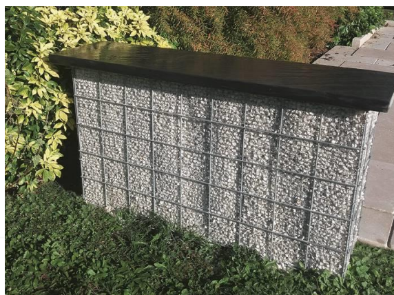
Les extras - Des espaces délimités avec élégance et ingéniosité grâce aux gabions