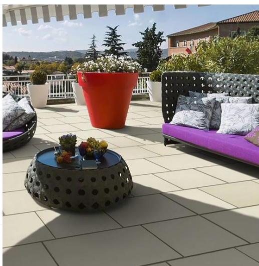
Dalles PéPLum pour terrasse XXL