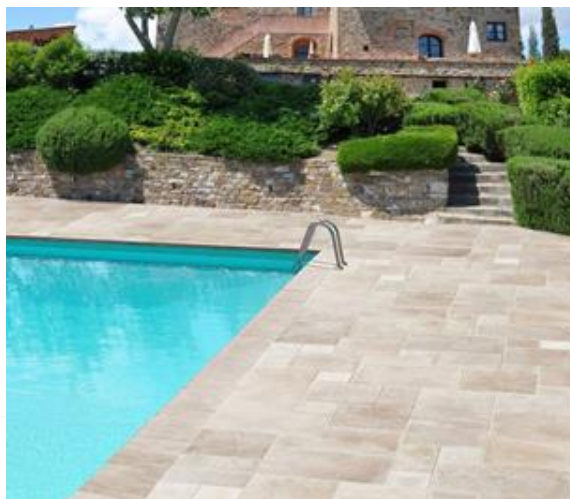
Calcaire Pharaon pour un mariage de naturalité et de raffinement